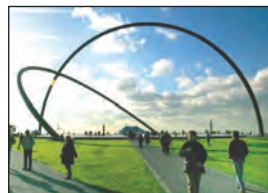
Cay Süberkrüb Landrat